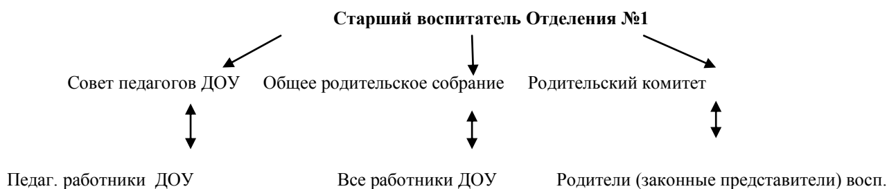
Схема структуры управления Отделения №1

3-ий уровень управления осуществляется воспитателями, муз. руководителем, учителем-логопедом, педагогом - психологом обслуживающим персоналом; - объект управления – дети и родители (законные представители).